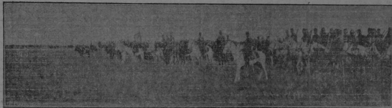
Caballería turca desplegada en orden de combate